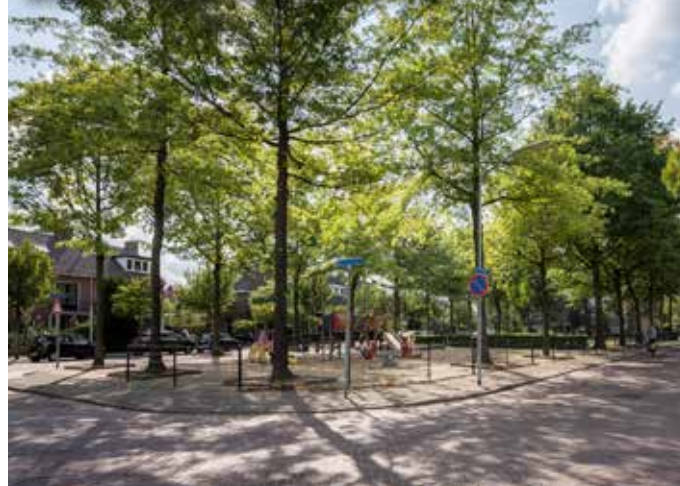
Achillesstraat in de wijk Sportpark

De energietransitie staat vandaag de dag volop in de belangstelling. Ook de bewoners van de Bredase wijk Sportpark zijn druk bezig hun huis te verduurzamen. Uit de enquête die in 2022 is uitgezet door de wijkraad Sportpark blijkt dat energie wordt gezien als één van de belangrijke thema's voor de komende jaren. Daarom is in het najaar van 2022 door een aantal actieve buurtbewoners de 'Werkgroep Energietransitie Sportpark' opgezet.